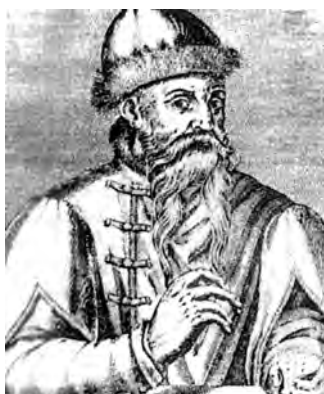
A invenção dos tipos móveis por Gutenberg revolucionou a imprensa.