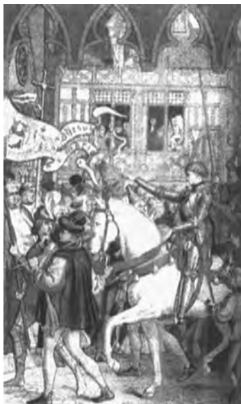
A jovem camponesa Joana d'Arc tornou-se o símbolo da luta da França contra a Inglaterra.