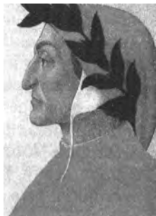
A Divina Comédia , uma das obras pré-renascentistas, e Dante Alighieri, seu autor.