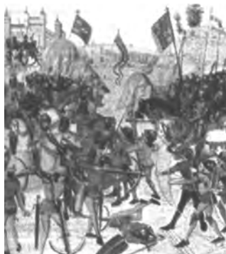
A batalha de Crécy, uma das muitas travadas entre ingleses e franceses na Guerra dos Cem Anos.