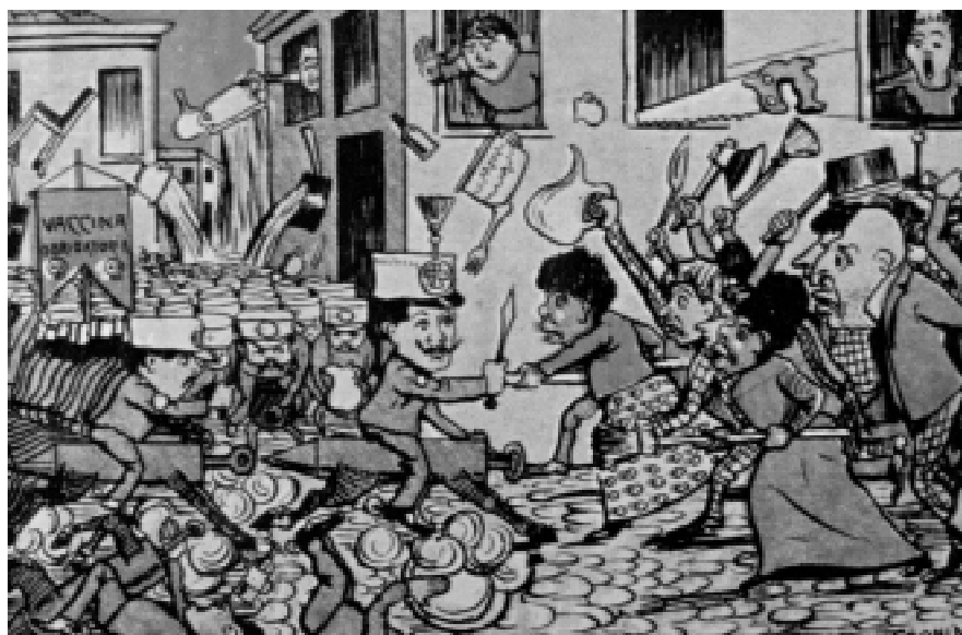
A imprensa brincava com a obrigatoriedade da vacinação.

Apesar disso, na década de 1920 (que estudaremos no próximo módulo), os trabalhadores urbanos e o movimento operário continuariam no centro da chamada questão social .