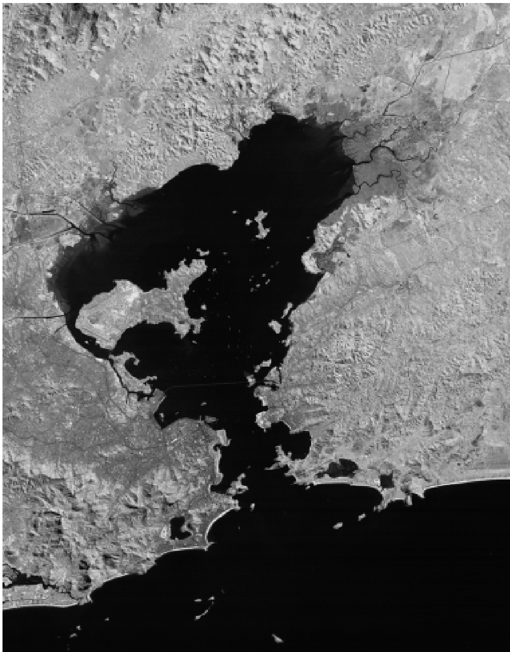
Imagem de satélite da baía de Guanabara.

As imagens orbitais e as fotografias aéreas vêm servindo de fonte de dados para estudos e levantamentos geológicos, ambientais, agrícolas, florestais, urbanos, oceanográficos, entre outros. Com ganho de tempo, elas permitem identificar, circunscrever e descrever as unidades de paisagens , como florestas, conjuntos de montanhas ou desertos existentes na superfície da Terra, que se apresentam com cores e texturas diferenciadas em uma imagem de satélite.