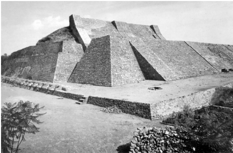
Pirâmide do México

Três regiões foram especialmente povoadas por sociedades que apresentavam um alto grau de desenvolvimento, como mostram os templos e palácios que deixaram. Essas ruínas ainda hoje podem ser visitadas.