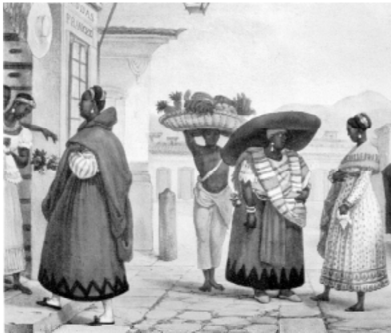
Cena de rua do Rio de Janeiro, registrada em aquarela de Debret.

Essa movimentação cultural foi acompanhada da criação do primeiro jornal editado na colônia: a Gazeta do Rio de Janeiro . Tudo isso permitiu uma maior circulação de idéias. Mas a censura continuava presente.