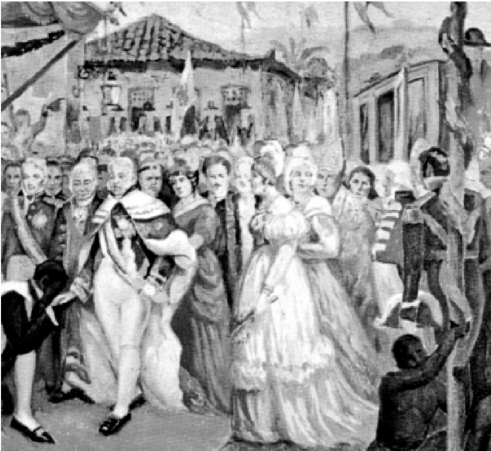
Debret também retratou várias cenas com a família real, como esta em que aparece d. João VI.

Esses elementos dinamizadores tomaram ainda maior vulto a partir de 1815, com a elevação da colônia a Reino Unido a Portugal. A sede do novo reino passou a receber delegações estrangeiras e a abrigar grande parte da administração portuguesa. Aos olhos de muitos, o Rio de Janeiro transformava-se em uma cidade portuguesa. Mais do que isso, surgia o que alguns denominavam a “ nova Lisboa ”.