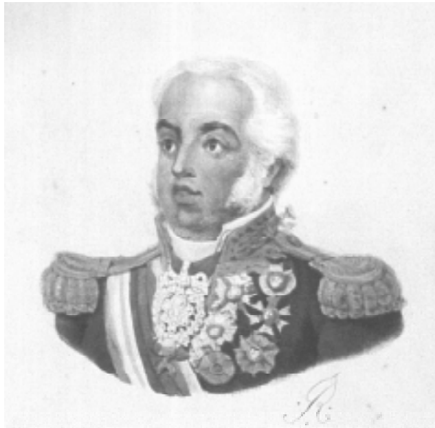
O príncipe regente d. João.

Mas, como vimos, não foi isso o que ocorreu. Por quê? O que estava acontecendo? Uma possível resposta para essa pergunta é simples: a situação portuguesa e européia ainda era instável, e no Reino do Brasil a família real não encontrava maiores problemas. Vejamos uma outra hipótese, bem mais interessante, e que vem sendo, nos últimos tempos, bastante explorada pelos historiadores. O que ocorreu é que a política de d. João produziu muito mais do que uma renovação cultural na cidade do Rio e Janeiro.