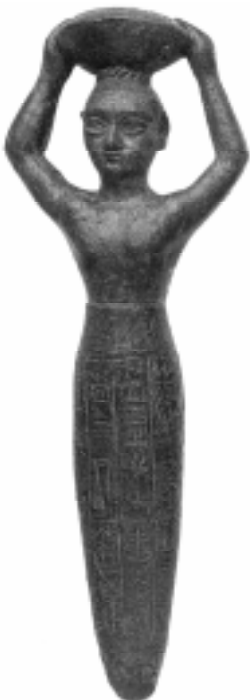
Figura que representa homem com colheita.

Os semitas não ficaram assistindo à dominação dos povos ários sem fazer nada. Eles começaram a aprender as novas técnicas para lutar com as mesmas armas usadas por aqueles que os dominaram.