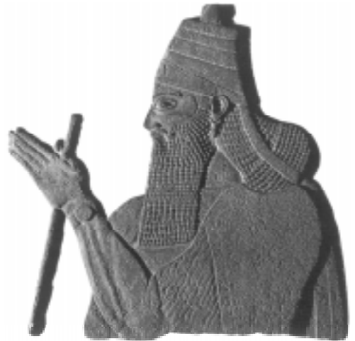
Homem esculpido em pedra.

Os sucessores de Nabucodonosor acharam que ninguém conseguiria entrar na cidade de Babilônia e começaram a relaxar a segurança. Conclusão: os persas , outro povo ário do planalto do Irã que tinha dominado os medos, sob o comando do rei Ciro , capturaram a cidade de Babilônia. A Mesopotâmia tornou-se, então, mais uma província do vasto império persa.