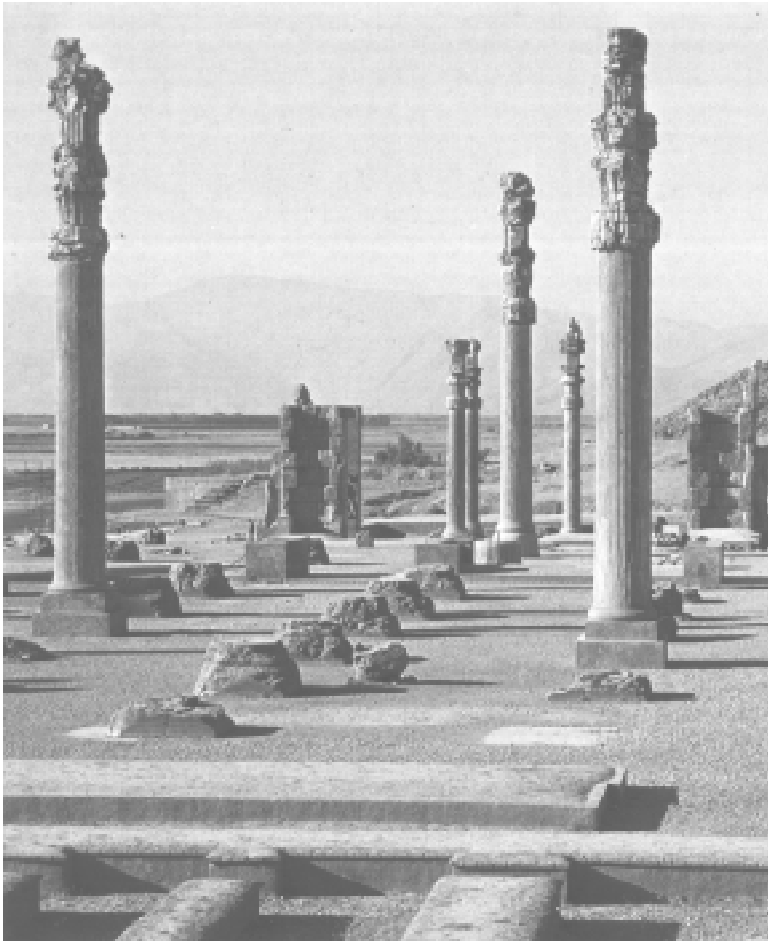
Ruínas de palácio da época.

Por volta de 1100 a.C., Agamenon , rei de Micenas, querendo pôr fim à situação, liderou uma coalizão de helenos contra Tróia. A guerra, a primeira entre a Ásia e a Europa, durou dez anos. Os gregos penetraram na cidade escondidos dentro de um enorme cavalo de madeira com o