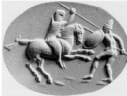
Guerreiros representados em alto relevo.

Dario , o imperador da Pérsia, exigiu a rendição das cidades gregas. Quase todas as cidades se renderam, menos Atenas e Esparta. Foi assim que começou a primeira guerra médica , assim chamada porque os gregos achavam que os persas eram os medos , um dos povos ários que vimos antes.