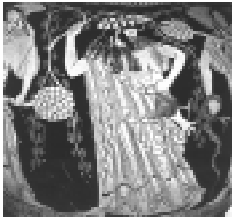
Decoração de vaso grego.

Esparta foi fundada pelos dórios. Como eram pouco numerosos, eles estabeleceram uma disciplina militar muito rígida para manter os privilégios que