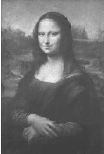
A Monalisa, pintura de Leonardo da Vinci.

Na península Itálica, os mecenas deram impulso decisivo ao Renascimento. Na cidade de Florença, a família Médici contribuiu para a construção de inúmeras obras renascentistas. Os papas Júlio II e Leão X transformaram Roma na capital da arte renascentista.