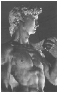
No Renascimento, o corpo humano voltou a ser valorizado.

A nova cultura humanista foi patrocinada por príncipes e comerciantes enobrecidos que enriqueceram com a expansão comercial do final da Idade Média. Os ricos mecenas , como eram chamados os patrocinadores do novo conhecimento, contribuíam com seu dinheiro para o desenvolvimento e a difusão da arte renascentista. Eles financiavam e protegiam os sábios e artistas.