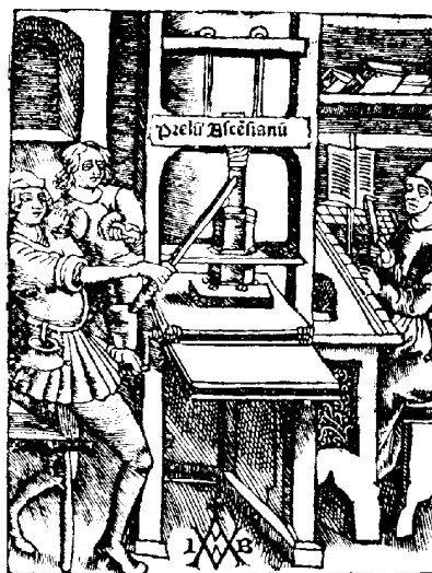
Gravura que mostra a primeira prensa manual para a publicação de livros.

A presença de mais moeda circulante e a acumulação dos lucros do grande comércio geraram o capitalismo comercial . Surgiram grandes bancos , que financiavam as monarquias absolutistas da Europa.