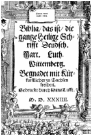
Capa da primeira Bíblia escrita em alemão.

cobrar a esmola correspondente ao perdão pelos pecados. Vários clérigos criticaram a atitude do papado.