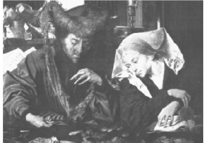
Os cambistas, símbolo das operações mercantis.

Para sustentar essa política exportadora, era necessário contar com uma poderosa marinha mercantil e de guerra . Assim, a França aumentou sua frota e iniciou a expansão colonial, visando obter mercados e matérias-primas para os produtos manufaturados franceses.