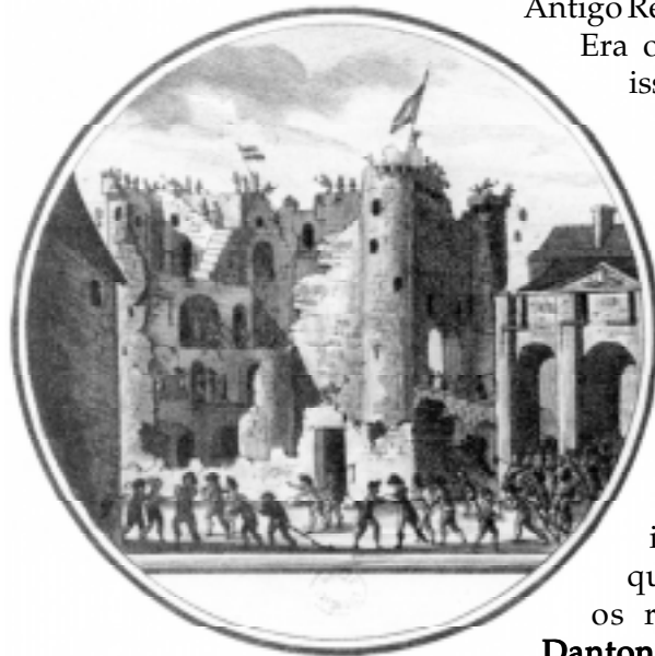
A queda da Bastilha.

A massa invadiu o palácio de Versalhes, obrigando a família real a voltar a Paris. Muitos nobres fugiram para o exterior, onde incitaram vários governos estrangeiros a intervir contra o novo regime.