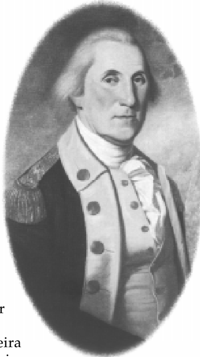
George Washington, primeiro presidente dos Estados Unidos.

A Revolução Americana abriu a primeira fissura no Antigo Regime. Poucos anos depois, os franceses se sublevaram contra o absolutismo.