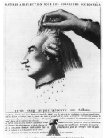
Caricatura sobre a decapitação de Luís XVI.

O rei foi preso, acusado de tramar contra o regime. A Assembléia então convocou a Convenção Nacional para escrever uma nova Constituição. O jornal de Marat incitava o povo a eliminar os traidores dentro da França. O povo tomou as prisões e matou membros da nobreza e do clero.