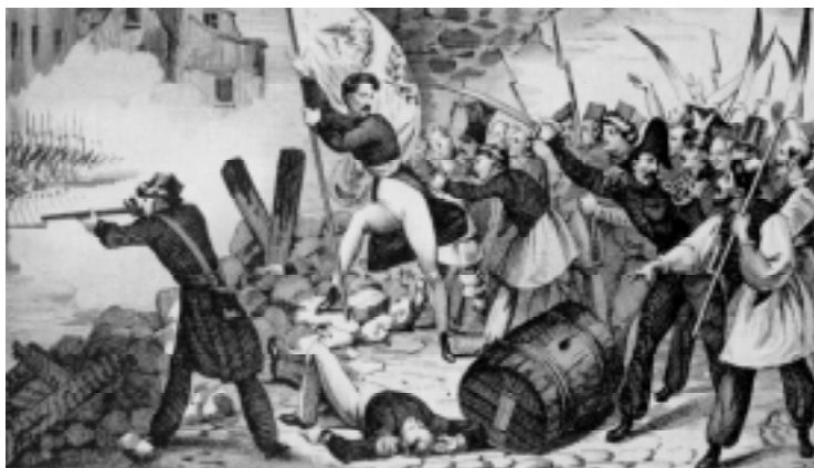
Rebelião em Varsóvia.

Após o Congresso de Viena, a Polônia havia ficado subordinada à Rússia. Com auxílio de franceses, Varsóvia se rebelou contra a dominação russa. Em pouco tempo, o movimento liberal e nacionalista atingiu todo o país. Tropas do czar da Rússia sufocaram o movimento violentamente.