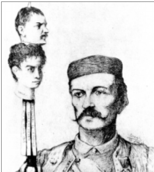
Ilustração de Pedro, da Sérvia.

No final do século XIX, houve várias sublevações contra a dominação turca. A intervenção russa motivou a realização do Congresso de Berlim , em 1878 , para discutir a questão balcânica. As resoluções do Congresso foram as seguintes: