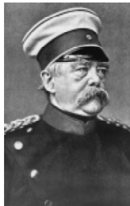
Otto von Bismarck

Na Europa, a política colonialista alemã se concentrou na região dos Balcãs. Os capitais alemães tiveram papel fundamental na construção de estradas de ferro e na venda de armas ao exército turco.